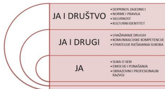
Grafički prikaz domena u međupredmetnoj temi Osobni i socijalni razvoj

Odgojno obrazovna očekivanja podijeljena su u tri domene pod nazivima Ja i društvo, Ja i drugi i Ja.