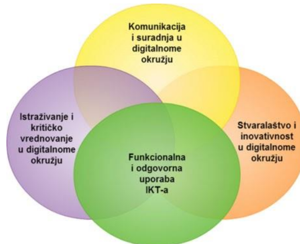
Struktura međupredmetne teme Uporaba informacijske i komunikacijske tehnologije

Međupredmetna tema Uporaba informacijske i komunikacijske tehnologije obuhvaća učinkovito, primjereno, pravodobno, odgovorno i stvaralačko služenje informacijskom i komunikacijskom tehnologijom u svim predmetima, područjima i na svim razinama obrazovanja.