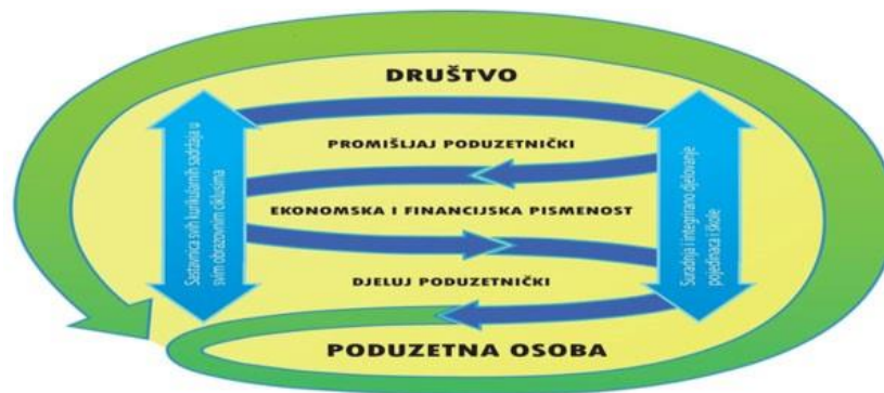
Prikaz domena u međupredmetnoj temi Poduzetništvo

Svrha učenja i poučavanja ove međupredmetne teme je razvijanje poduzetničkoga načina promišljanja i djelovanja u svakodnevnom životu i radu.