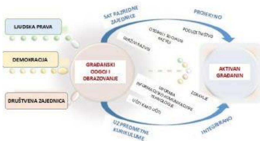
Schematski prikaz Međupredmetne teme Građanski odgoj i obrazovanje

Temeljne vrijednosti koje se promiču učenjem i poučavanjem Građanskog odgoja i obrazovanja su odgovornost, ljudsko dostojanstvo, sloboda, ravnopravnost i solidarnost. Osobita važnost pridaje se razvoju odgovornog odnosa prema javnim dobrima kao i spremnosti pojedinca da doprinosi širenju, razvoju i održavanju zajedničkih javnih dobara.